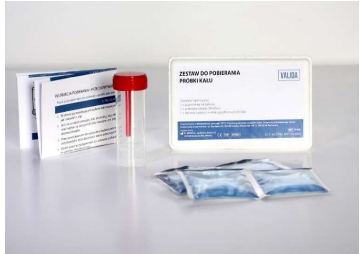
Zestaw pobraniowy kału

UWAGA: Transport próbek nie wpływa na wynik badania. Laboratorium każdorazowo sprawdza próbkę pod kątem jakości i przydatności do badania. Jeżeli będzie wymagane ponowne pobranie materiału, to pokryjemy koszty jego przesyłki!